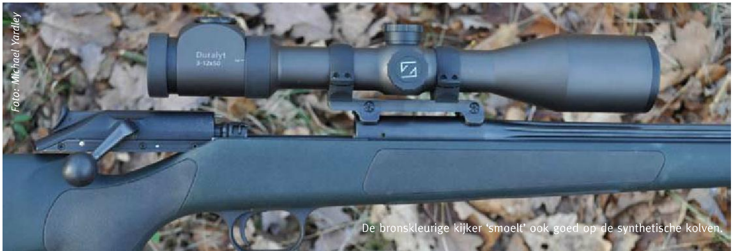
De bronskleurige kijker 'smoelt' ook goed op de synthetische kolven.