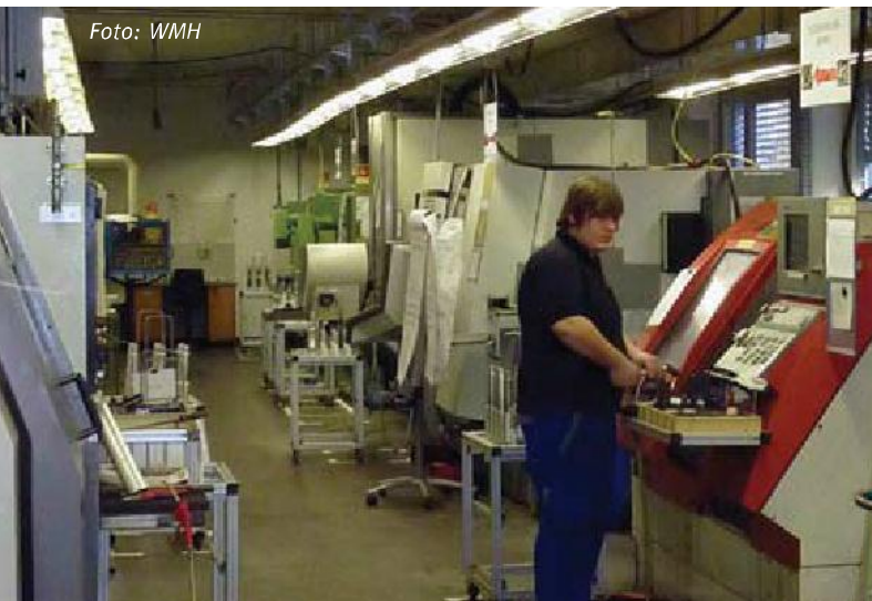
De complete productiestraat kan door één medewerker bemand worden. Mede hierdoor kan men de prijs laag houden.