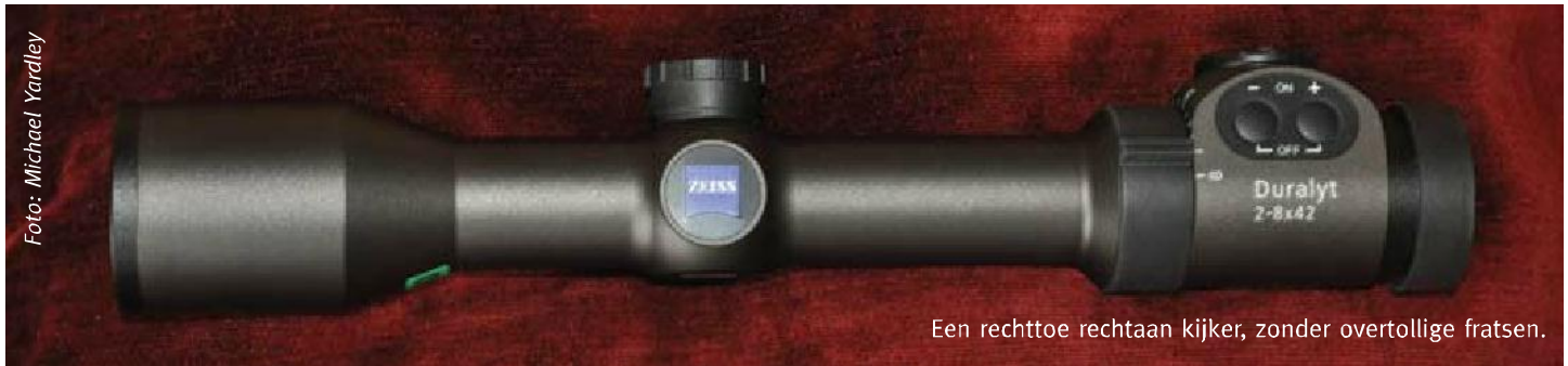
Een rechttoe rechtaan kijker, zonder overtollige fratsen.