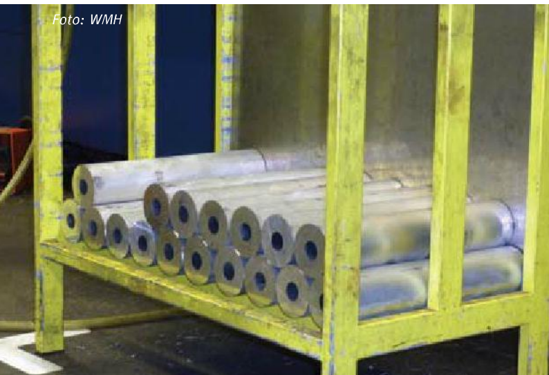
Iedere kijker wordt uit een massief blok aluminium gefreesd.